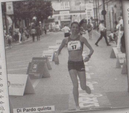
Di Pardo quinta

han- no concluso la propria gara da leader. Per la portacolori della Nuova Atletica Isernia c'è stato il tempo complessivo di 35'57".