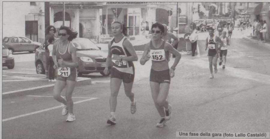
Una fase della gara