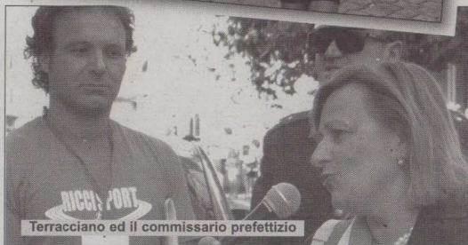
Terracciano ed il commissario prefettizio