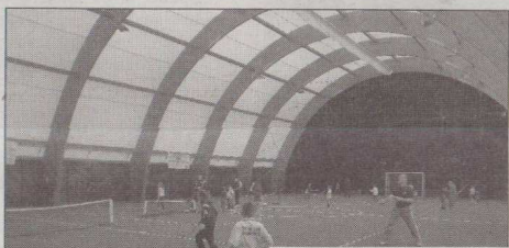
Due momenti dell'evento alla 'Baita' di Ferrazzano

pre sul fronte degli appuntamenti giovanili, la rappresentativa regionale impegnata nella Coppa delle Province ha iniziato nel migliore dei modi l'edizione 2012 della kermesse.