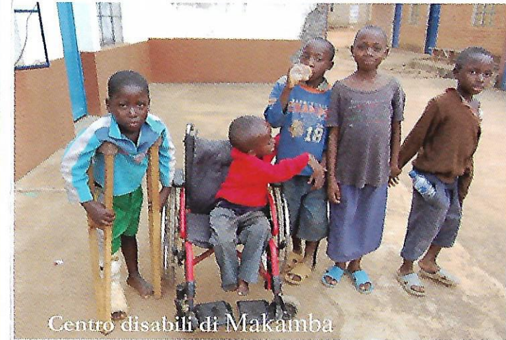
Centro disabili di Makamba