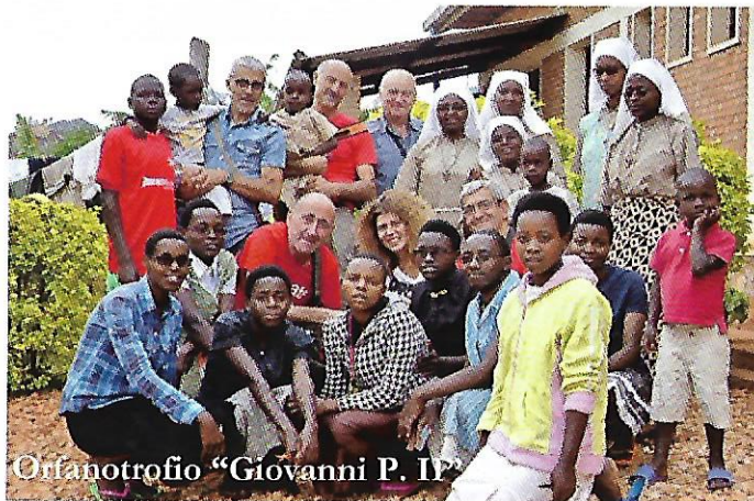
Orfanotrofio "Giovanni P. II"

Non erano ancora missioni umanitarie, ma servivano a farci conoscere il territorio e le sue problematiche.