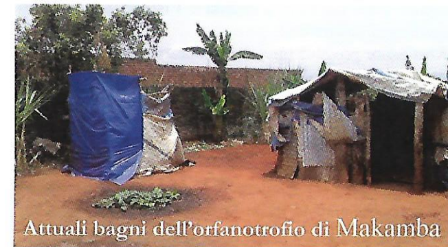
Attuali bagni dell'orfanotrofio di Makamba